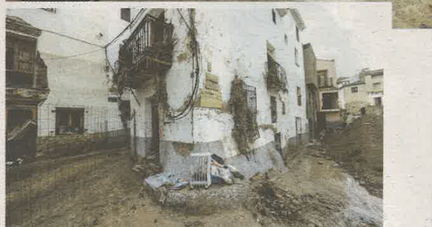
Vista de un rincón de Letur, en la actualidad y justo tras la DANA.

El Premio Coacm Permanencia, para obras con más de 20 años que destacan por su vigencia y correcto envejecimiento, fue a La Roda, a las Bodegas Celaya, obra de Eloy Celaya, reconocidas por «su adecuación al uso y su lenguaje atemporal».