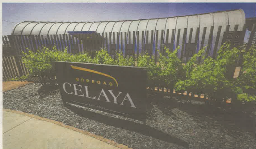
Las Bodegas Celaya de La Roda, hechas en dos fases, entre 1999 y 2003.

administración) se integran en un único sistema espacial.