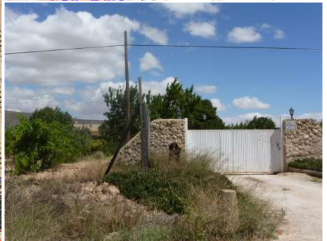
CL DISEMINADOS 276