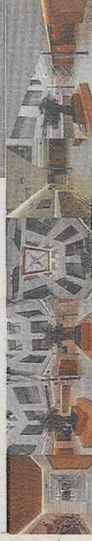
También ha sido seleccionada la 'Casa Josifo' de Manzanares. / LT