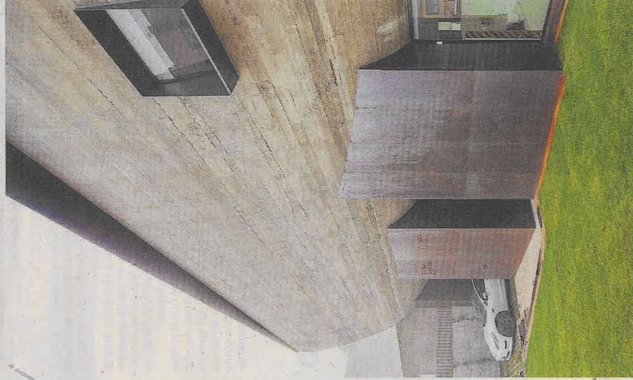
En el ámbito de la Edificación, ha sido seleccionada la Casa Nau, en Ciudad Real. / LT

En el ámbito de Paisaje y Espacio Público, se ha seleccionado la Remodelación del entorno de la plaza de toros Alcázar de San Juan. El pro-