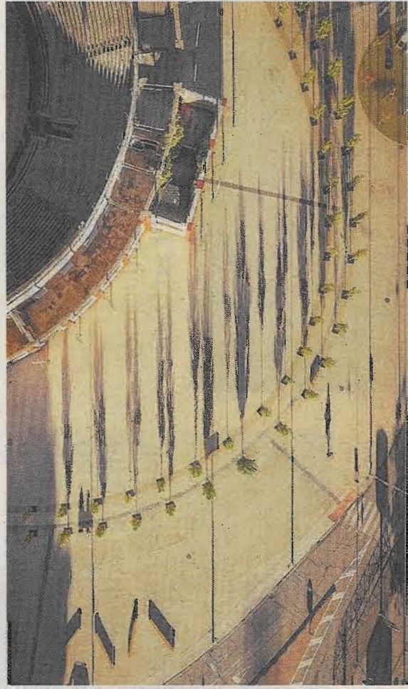
Se ha seleccionado la remodelación del entorno de la plaza de toros de Alcázar de San Juan. / LT