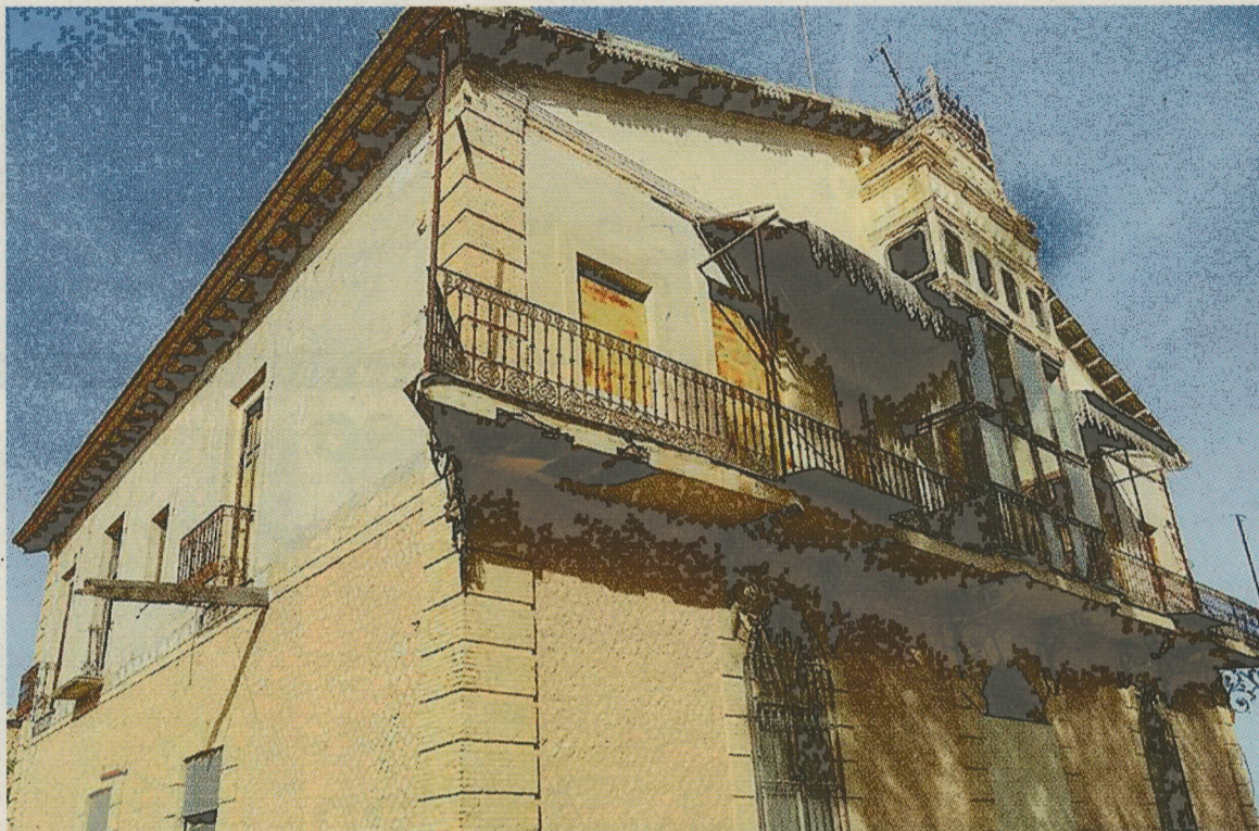
Vista exterior de una de las edificaciones de la Finca El Paso, en Caudete.

Dado el ya evidente deterioro de la finca y el temor de que desaparezca totalmente, al menos se intentó documentar su existencia, con un trabajo por José Francés, Jaime Giner, Joaquín Mollá y José Luis Simón, editado por la Universidad de Alicante en 2012. También fue el objeto de una exposición de fotografías, firmadas por Jaime Giner y José Francés, que se mostró primero en espacios de Caudete y después en el Colegio de Arquitectos de Albacete.