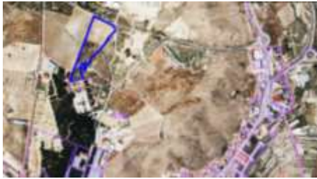
SITUACION EN EL LIMITE DE SUELO URBANO

Polígono 18 Parcela 1093 EL CEMENTERIO. TOBARRA (ALBACETE) S.: 25.927 m 2