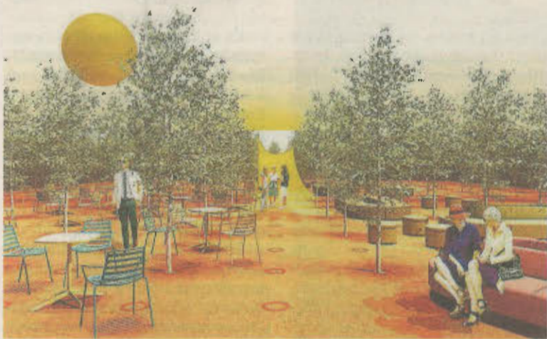
Vista del espacio, con pequeñas arquitecturas adicionales.