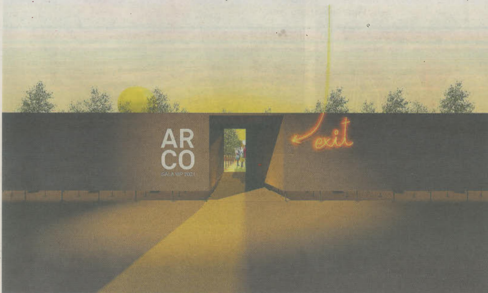
'Exit' es una propuesta diferente e imaginativa para la zona VIP de la Feria ARCO en 2021.