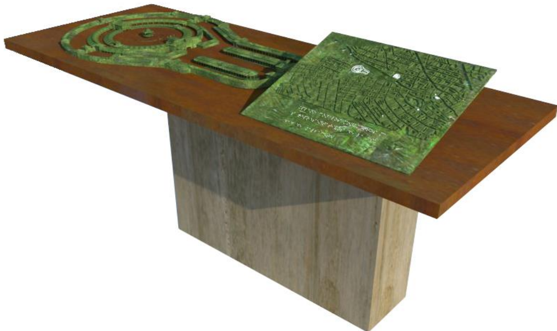
MAQUETA DEL RECINTO FERIAL