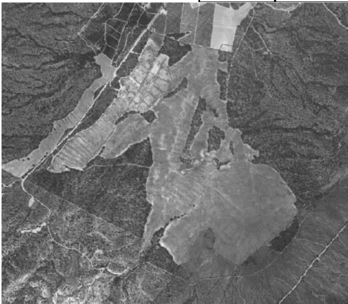
Plano del perímetro de la actuación

- Alternativa 1: Cerramiento perimetral con malla cinegética con implantación de pasos canadienses en las intersecciones con los caminos públicos.