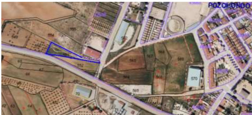
Superficie parcela 2.084 m 2