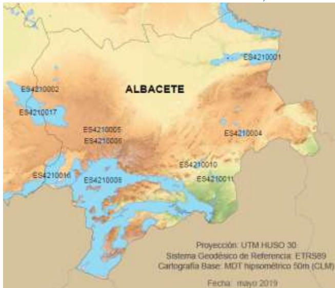
- Mapa 1. Espacios LIC / ZEC

ZEC/ZEPA ES4230013 - Hoces del Cabriel, Guadazaón y Ojos de Moya