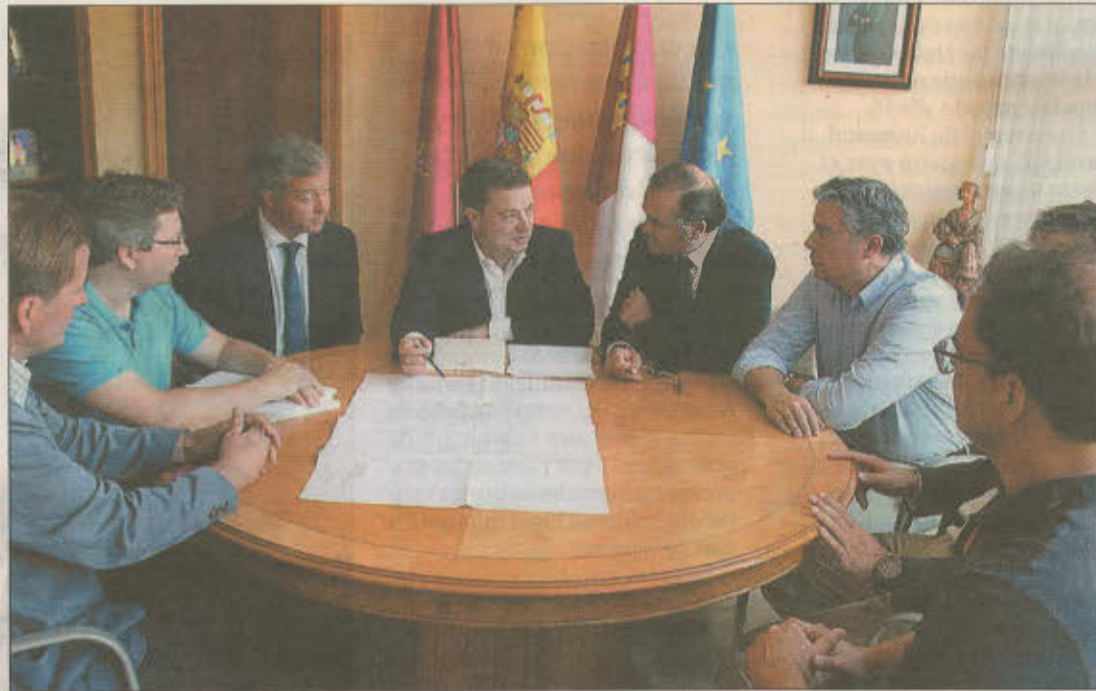
Un instante de la reunión que tuvo lugar ayer, en el despacho de Alcaldía.