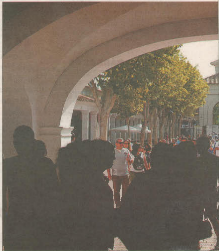
Imagen de archivo del Recinto Ferial.

Una vez que pasen los días de fiesta de 2018 podrán volver a retomarse estas obras sobre las que Manuel Serrano agradeció al Go-