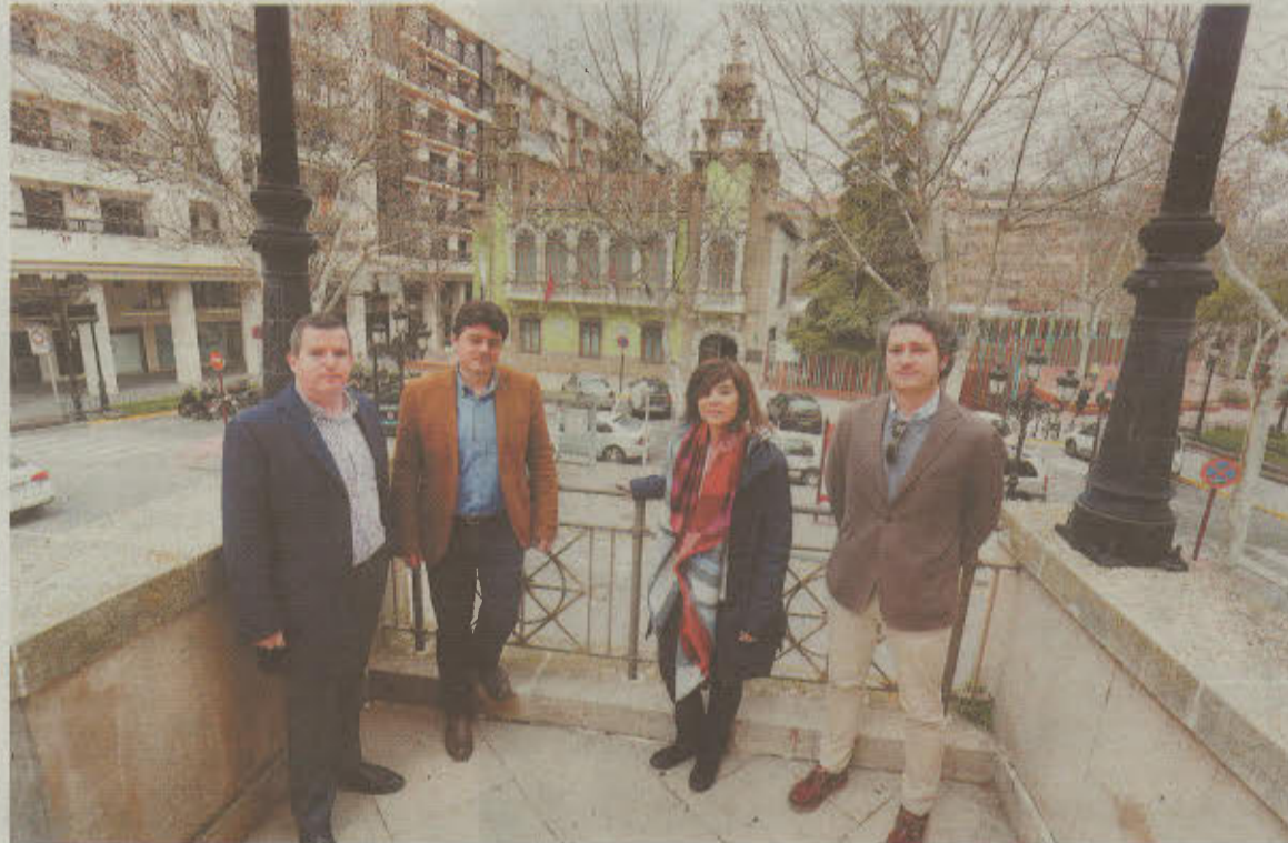
Los organizadores del concurso frente al Museo de la Cuchillería, zona para la que se plantearán ideas.

Navarro también concretó que la propuesta ganadora no será vinculante y el Ayuntamiento podrá tener en cuenta otras variables que no tengan que ver exclusivamente