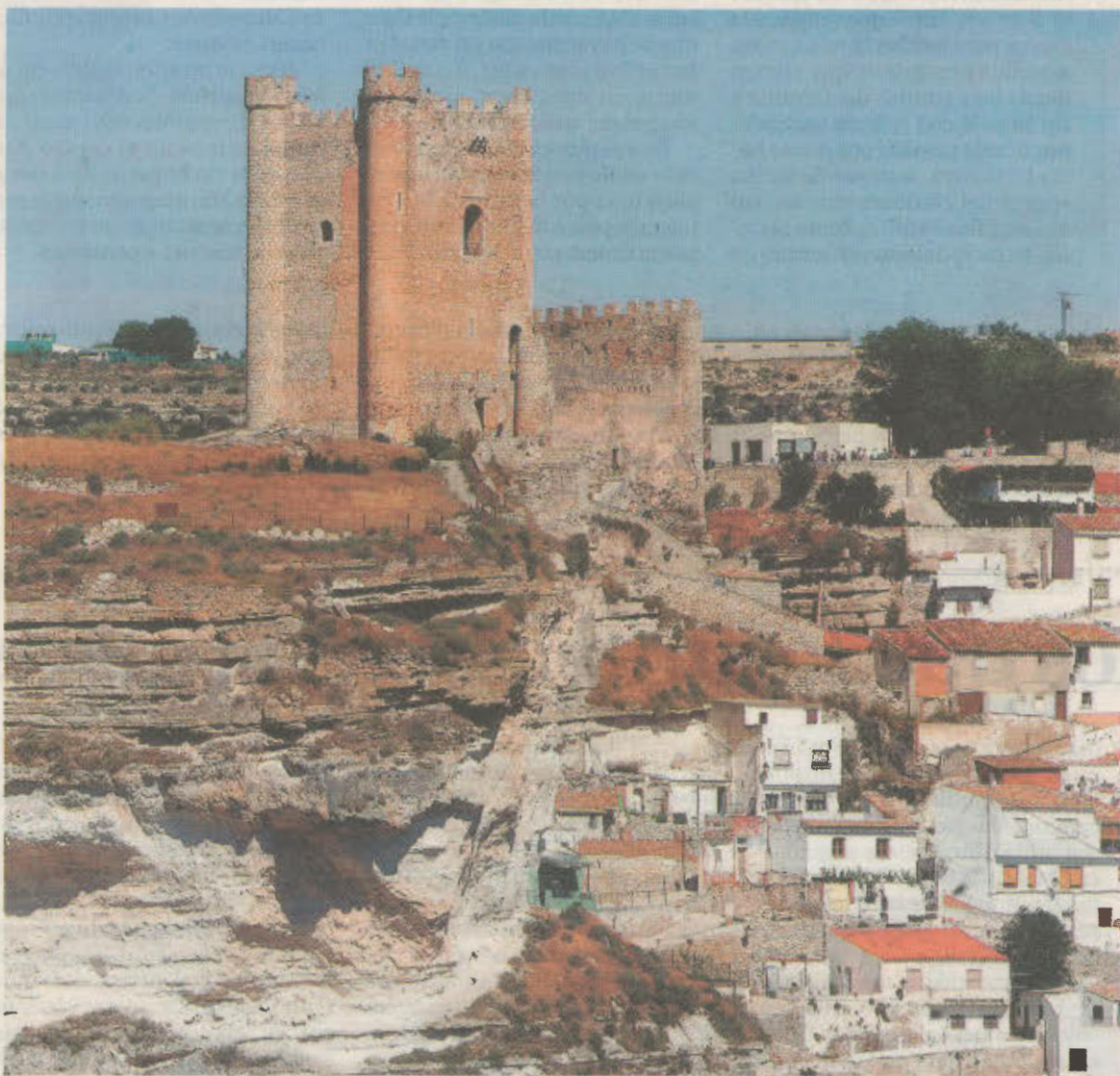
Entre las numerosas acciones se contempla también la reurbanización de la plaza del castillo.

El Ayuntamiento de Alcalá del Júcar publicó las actuaciones que se quieren llevar a cabo, hasta el 2024, para recuperar, preservar y promocionar el patrimonio; acciones recogidas en el Plan Director de Regeneración Urbana Integral del Conjunto Histórico-Artístico