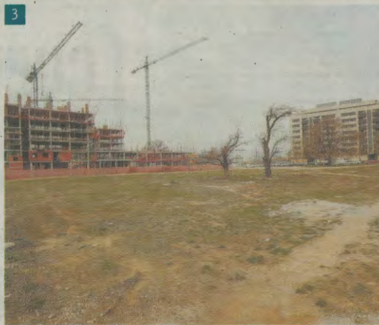
1 - Terreno de la calle Zamora que acogerá un área para perros. 2 - Solar ubicado junto al Ayuntamiento que será acondicionado como zona verde y área de juegos. 3 - Parcela de la avenida Cronista Mateo y Sotos.