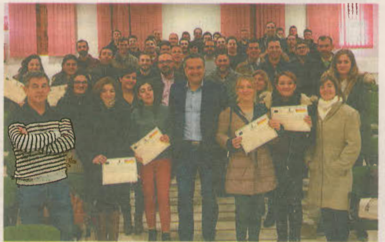
Los profesores y alumnos del curso posan con el director provincial.

El representante de la Consejería de Agricultura subrayó que «las ayudas para la incorporación de jóvenes a la actividad agraria en explotaciones viables, encaminadas