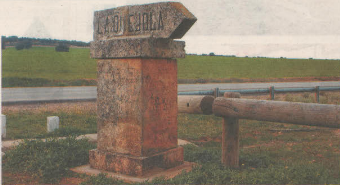
Un monolito de piedra indica la ubicación de la Quéjola.

«CLANDESTINAS». En la carta arqueológica municipal, realizada en el 2009, se advertía del «estado relativamente preocupante» de la mayoría de los yacimientos que hay en el término municipal de San Pedro. En algunos casos -decía dicho documento- los yacimientos están dañados «desde antiguo por excavaciones clandestinas, realizadas por gente de la zona o por la aplicación de maquinarias agrícolas». Los más afectados por estas prácticas han sido los yacimientos en llanura, data-