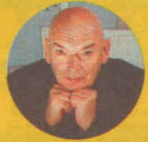
JEAN NOUVEL ARQUITECTO

«El Louvre de Abu Dabi me enseñó la poesía del desierto»