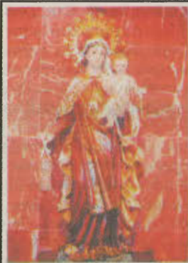
VIRGEN DEL CARMEN que se venera en el Oratorio de Albacete

(*) Doctor en Historia, profesor y miembro fundador del IEA.