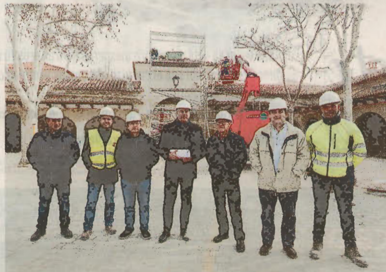
Arquitectos municipales y responsables de la adjudicataria, junto al concejal.

Las obras en el histórico edificio descubren los valores perdidos de esta 'joya' albacetense Sin persianas, ni tabiques, los arcos recuperan el tapial de cal eliminado por años de 'maltrato'