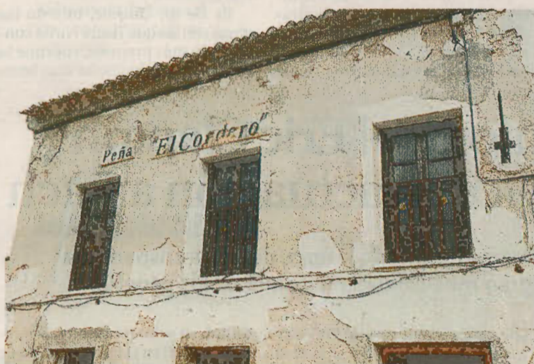
Sólo ha sobrevivido este cartel, el de la Peña El Cordero.

LONJA TERMINADA. Llegado el 7 de septiembre, la obra estará totalmente terminada en la zona de la Lonja, Talabarteros y en el exterior del Ferial. Pasados los diez días de fiesta, a finales de septiembre o primeros de octubre a más tardar, se retomarán las obras. La intervención en el Rabo de la Sartén se dejará para esta segunda fase, en los dos pabellones centrales, el Pabellón Municipal y el que gestiona Globalcaja, no está previsto inter-