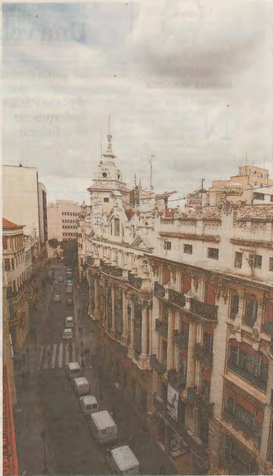
Los edificios a proteger se encuentran en la calle Ancha.

Tanto desde el Gobierno regional como desde el Ayuntamiento de Albacete se incidió en que no se repetirán hechos como el de las rejas, en un edificio de la calle Ancha, que desató la polémica por la que se inició el expediente que ayer quedó archivado.