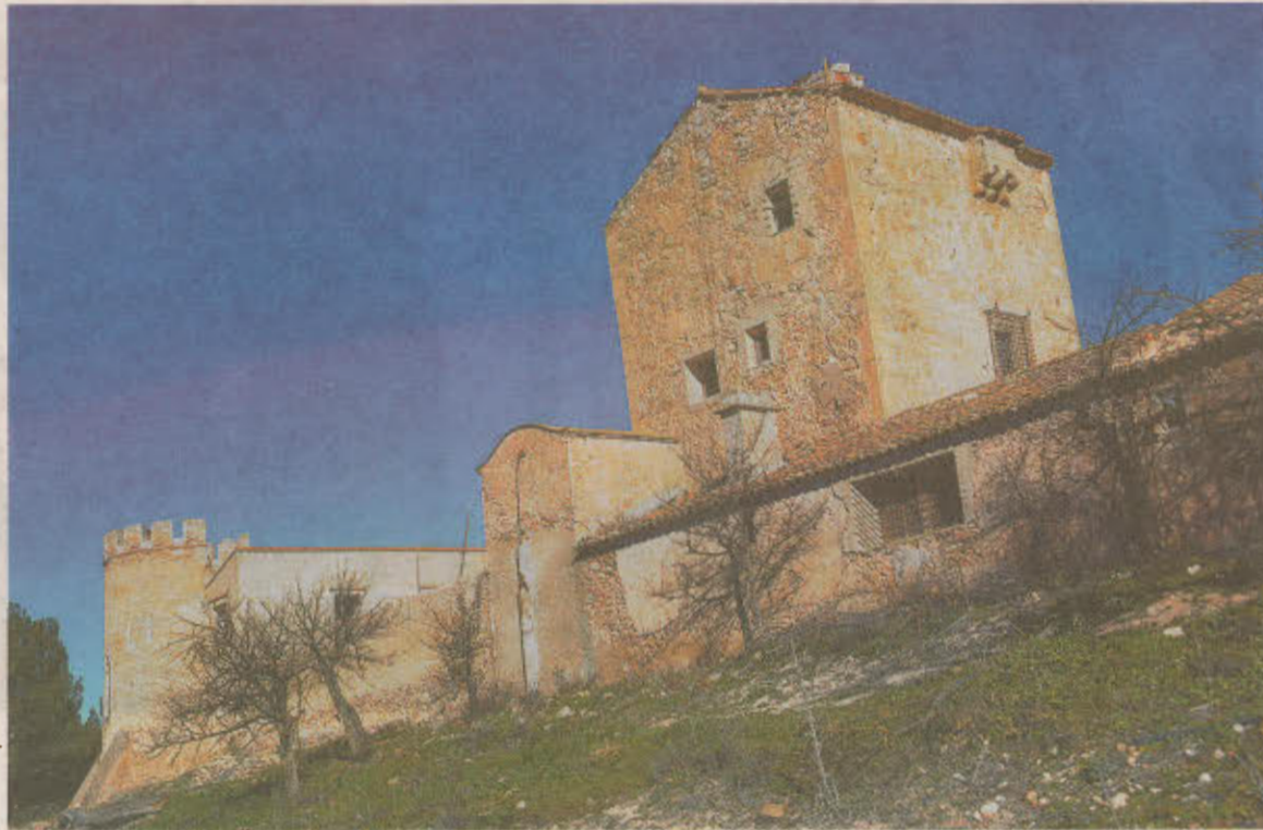
Imagen parcial del torreón y parte de la muralla de la edificación medieval conocida como Torre Grande.

DETERIORO. Señalan desde Torre Grande el hecho de que por desgracia, la situación física de ese monumento no ha hecho más que deteriorarse en los últimos años. «Pese a que goza de la catalogación de Bien de Interés Cultural -dice Os-