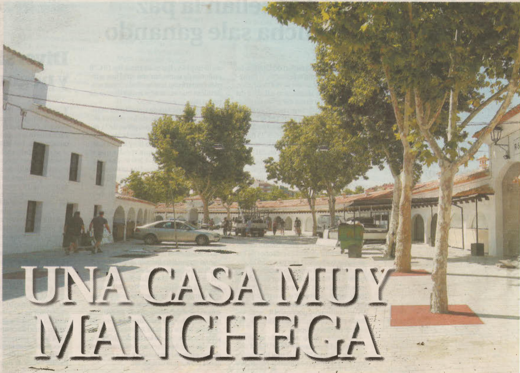
Aspecto que ofrecía esta semana la zona de la Lonja Vieja, donde el proyecto de rehabilitación ha intervenido.

CAMBIOS. Sin embargo, durante muchos años, determinados adjudicatarios han pintado paredes, colocado aparatos climatizadores sobre las antiguas cubiertas, instalado tuberías, realizado salidas de humos donde les ha venido en gana, han realizado cerramientos sin ninguna uniformidad, han construido hasta mostradores de obra y han sustituido los suelos originales por baldosas, moquetas, adoquines... La Feria es de todos, sí, pero con respeto y sentido común. Recuperar, en la medida de lo posible, aquel inmueble de la