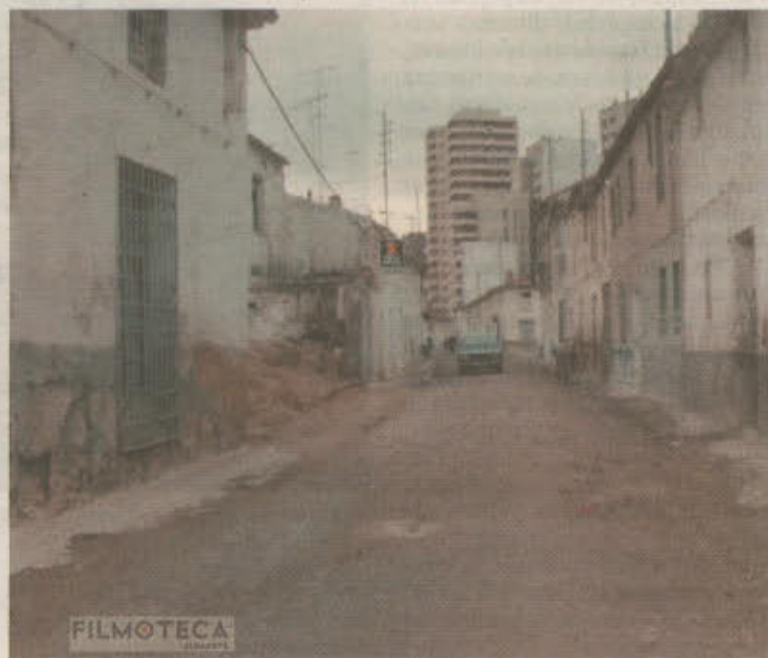
Aspecto de la calle Tejares en la mitad de los años 70.

El procedimiento para donar todo tipo de material audiovisual o impreso, confirmó Jesús López, director de la Filmoteca de Albacete, es muy sencillo, «simplemente, se acerca, nos comenta qué puede tener, programas de mano a películas, pasando por revistas u otros materiales, porque hace unos días precisamente un aficionado se acercó por aquí y nos trajo unos programas de mano de la plaza de toros, de los años 60, porque en esa época se hacía cine de verano en la plaza de toros, y nos los cedió. También hacemos pequeñas exposiciones y antes de las proyecciones, incluimos fotografías de todo esto que nos van donando, con el nombre de la persona o personas que van haciendo grande este archivo de la Filmoteca». Por eso el procedimiento es tan sencillo y si es película, hacemos una copia digital y se la entregamos.