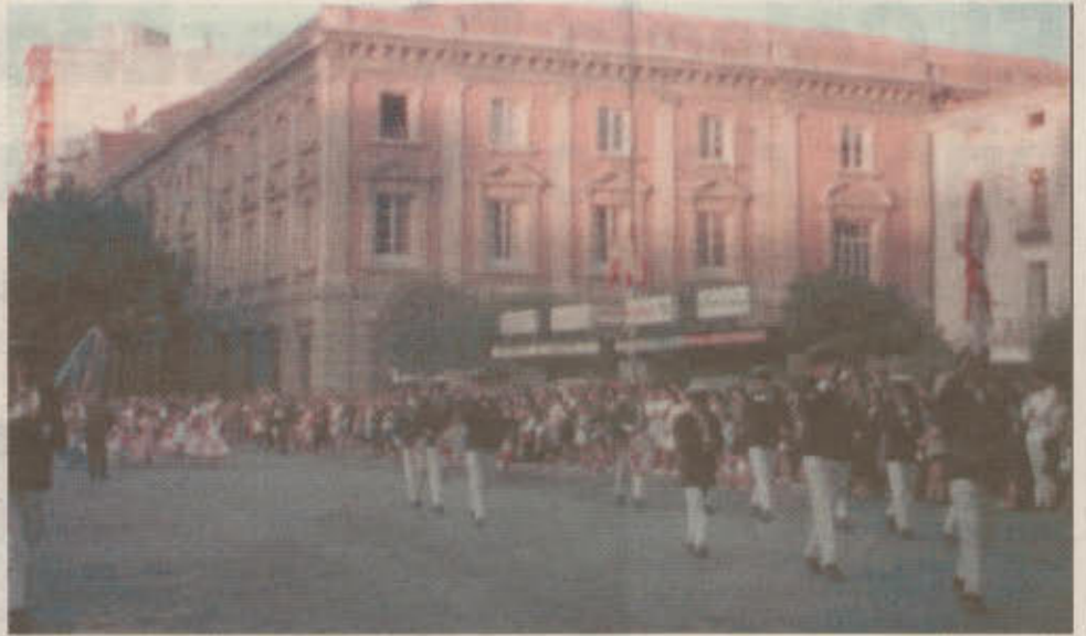
Imagen de la Audiencia Territorial, con un desfile de la Feria.