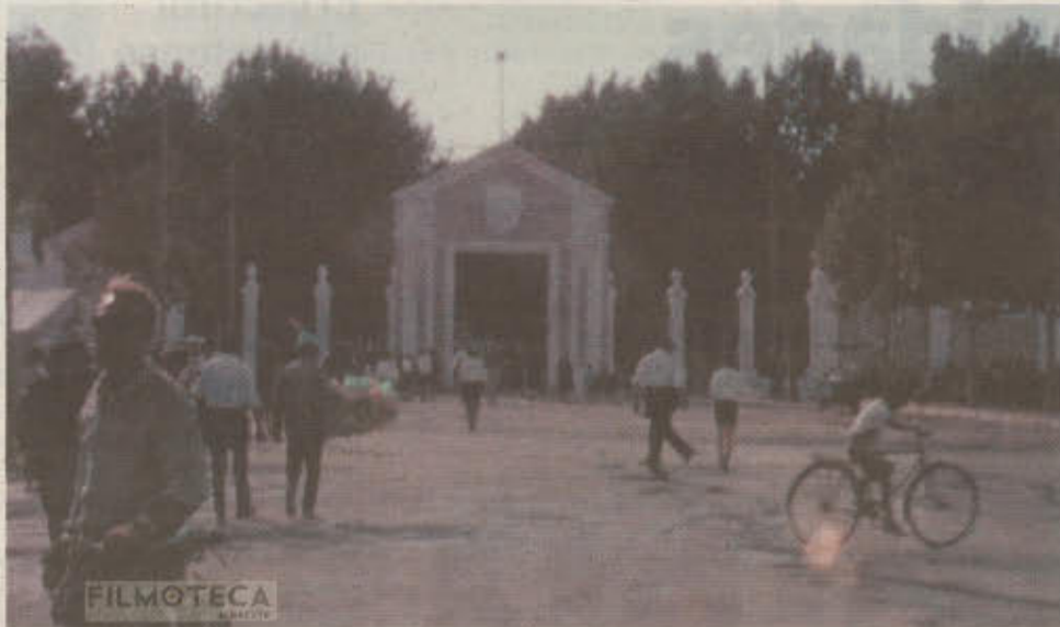
Antigua Puerta de Hierros de la Feria de Albacete, en 1965.