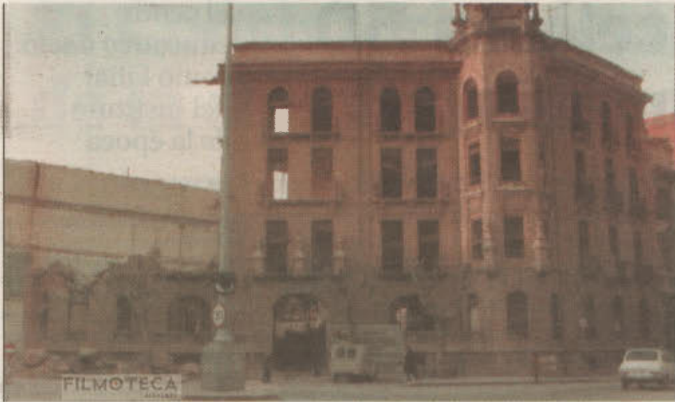
Un cámara filmó parte de la demolición del edificio de la Casa de Canciano López.