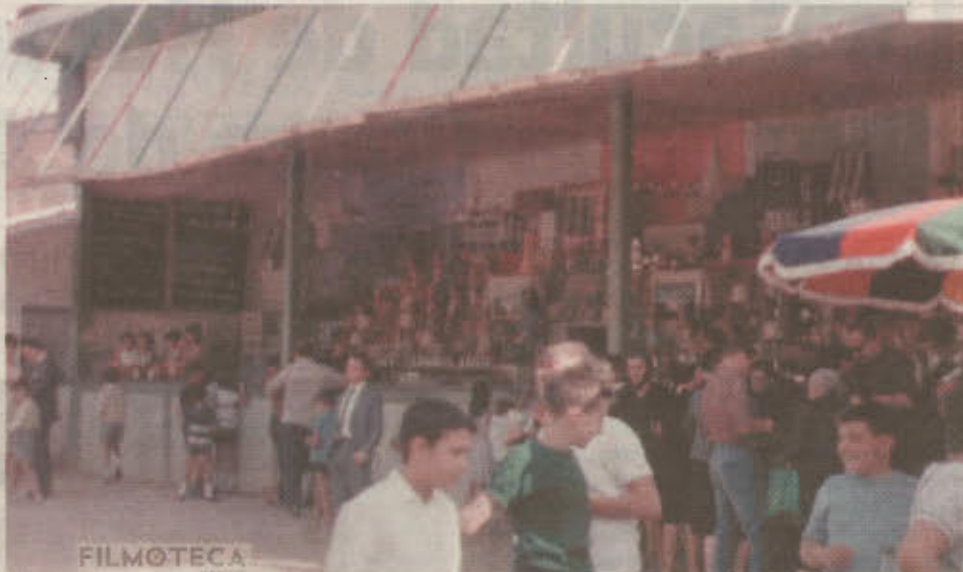
La Tómbola de Cáritas a mediados de los años 60.