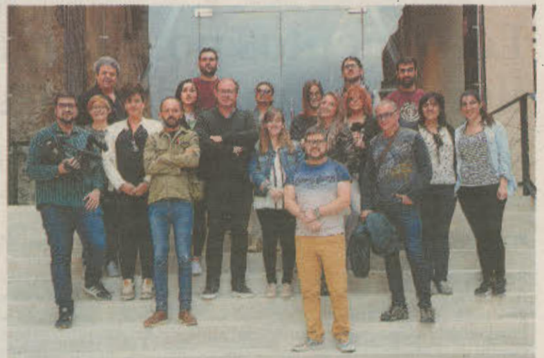
Periodistas, técnicos y miembros de la Corporación en la primera vista.