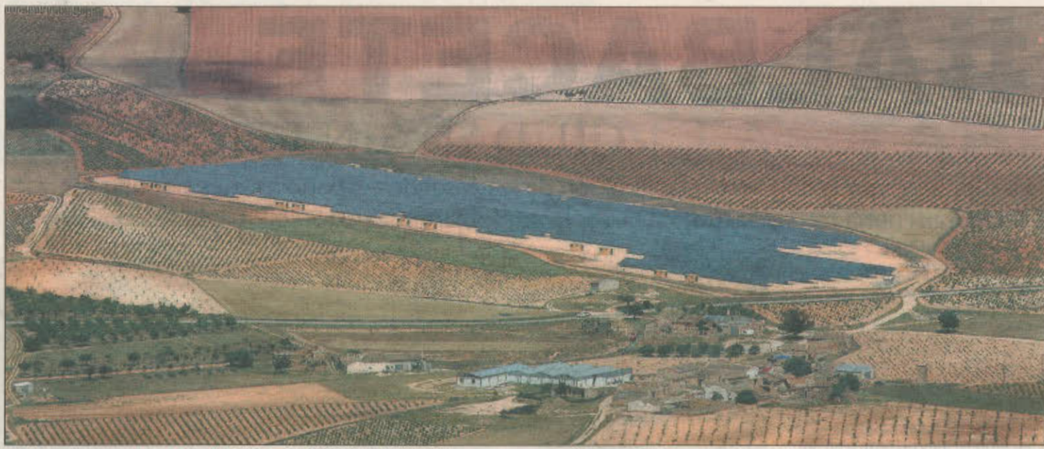
Campos cultivados y huertos solares conforman el paisaje en las inmediaciones de Alcalá del Júcar.