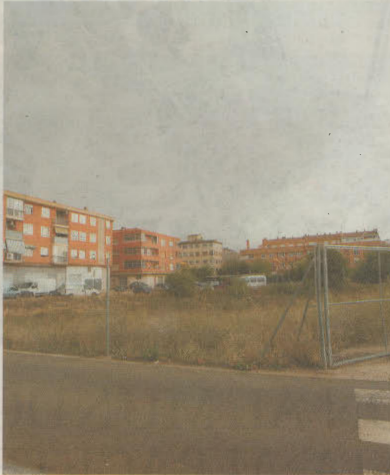
Terreno que se corresponde con la Unidad de Actuación 31, en Cañicas.

La previsión inicial, en manzana cerrada, es la de construir 35 viviendas con 3.640 metros cuadrados (1.302 metros cuadrados en planta baja y 2.338 en plantas superiores).