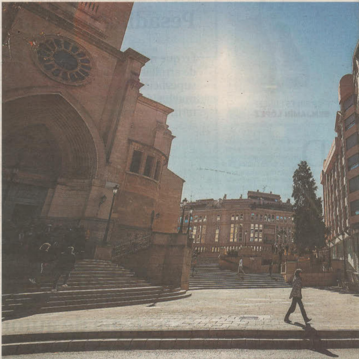
La división entre plazas actual quedará reducida al mínimo en el futuro.