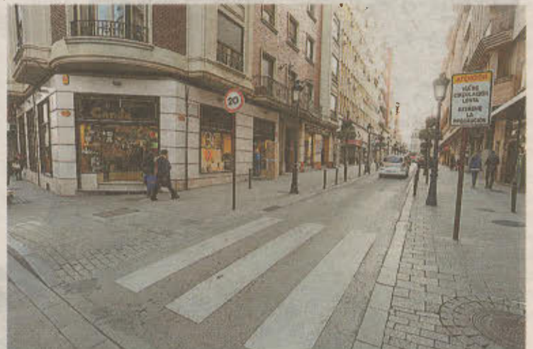
El cierre al tráfico de la calle Rosario será realidad en semanas.

«Como en el resto de fases, el objetivo es dejar toda la plaza de rasante única» y encontrar la mejor fórmula para aprovechar el espacio para los peatones. Eso se logrará, como ya apuntó en su momento el responsable de Movilidad Urbana, moviendo la parada de autobuses urbanos -que ahora queda justo en la mitad de la plaza- y estudiando también qué pasa con los aparcamientos (pocos) que hay actualmente.