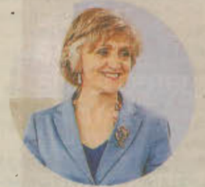
MARÍA LUISA CARCEDO MINISTRA DE SANIDAD

La Fundación Konecta y la Fundación Universia, impulsada por el Banco Santander, presentaron ayer la VIII Convocatoria de Ayudas a Proyectos Inclusivos. Una iniciativa que promueve el acceso al empleo y la participación de este colectivo dentro del territorio nacional y que sirve como canal directo para conocer las necesidades de las organizaciones del Tercer Sector. En la edición de este año, la dotación económica ascenderá a 50.000 euros, dirigidos a proyectos que apoyen la consolidación del principio de igualdad de oportunidades.