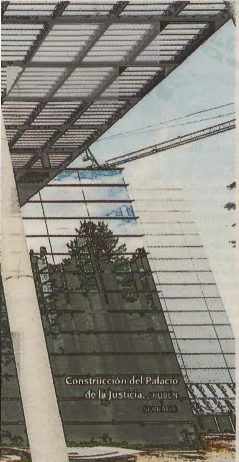
Construcción del Palacio de la Justicia, RUBÉN