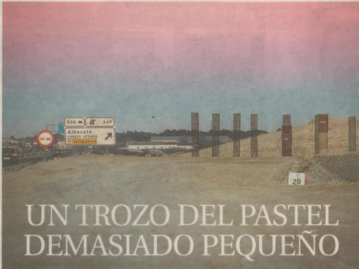
Obras de la Circunvalación Sur, tramo de la A-32 Autovía Linares-Albacete, que unirá las carreteras de Jaén y Murcia.

ABASTECIMIENTO: Sobre el papel, se trazó un plan para abastecer con agua del Júcar, desde el embalse de El Picazo, a 69 pueblos del sur de Cuenca y el norte de Albacete. De esta obra que debía acometer el Estado nunca más se supo.