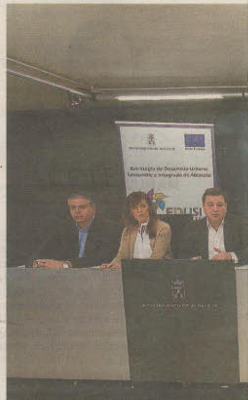
El alcalde y parte de su equipo.

ver con un proyecto que se incluye dentro de la Estrategia de Desarrollo Sostenible e Integrado (Edusi) de Albacete, cofinanciada por el Fondo Europeo de Desarrollo Regional en el marco del Programa Operativo Feder 2014-2020. Estrategia con la que el Ayuntamiento está llevando a cabo diversas actuaciones, después de que se le concedieran 15 millones de euros, entre las que se incluyen la reforma de la antigua Comisaría de Si-