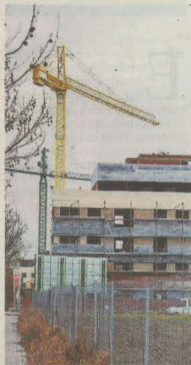
Una vivienda en construcción.

Pensando en el objetivo 11 y bajo el lema Arquitectura... vivienda para todos , el próximo lunes se celebrarán el Día Mundial de la Arquitectura y el Día Mundial del Hábitat. Ambas celebraciones comparten el mismo día por decisión de la Unión Internacional de Arquitectos (UIA), que en 1996 decidió vincular al gremio de arquitectos con el desarrollo urbano sostenible, propuesto por la comisión