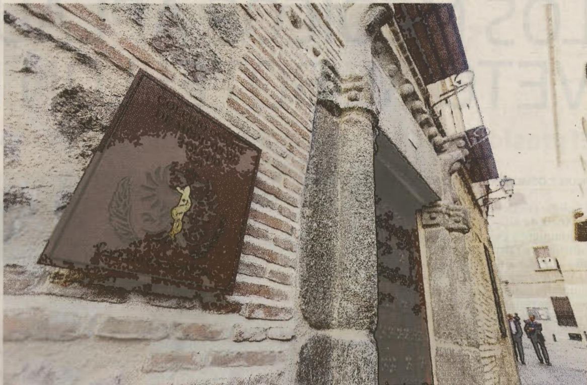
Sede de un Colegio de Médicos, en una imagen de archivo.

dría afectar negativamente a los usuarios de sus servicios que no verían suficientemente amparados sus derechos, tanto los referidos a las prestaciones como al comportamiento ético del profesional, y en particular en la aplicación de su criterio profesional o facultativo sin imposición del empleador.