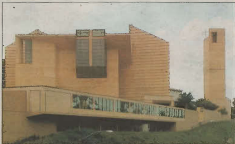
Catedral de Los Ángeles, localizada en pleno centro financiero de la ciudad.