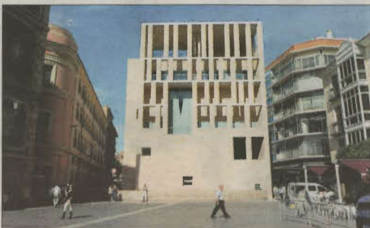
Fachada del Ayuntamiento de Murcia.