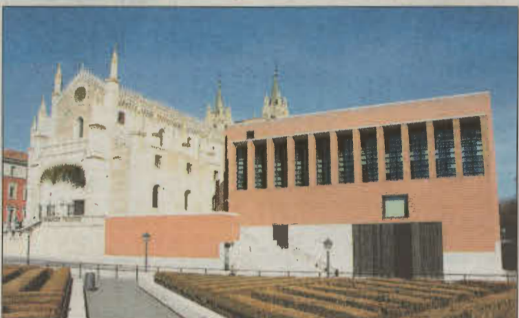
Ampliación del Museo del Prado, en Madrid.