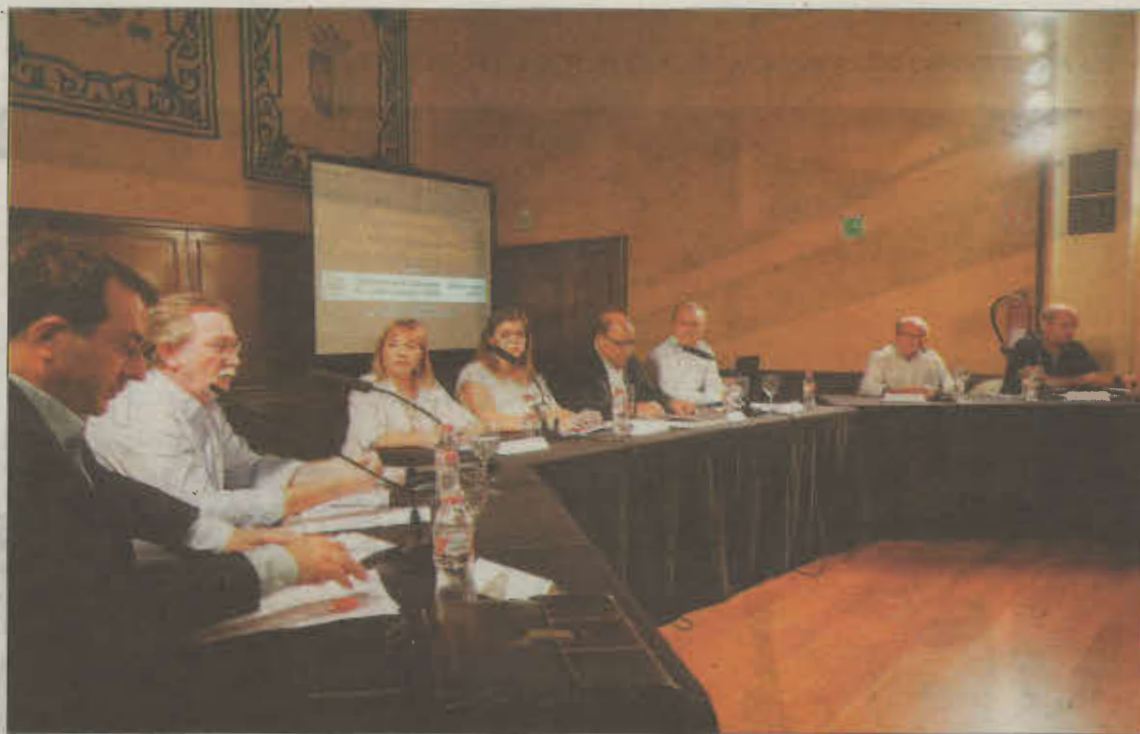
El foro, con motivo del Día Mundial de la Arquitectura, se celebró en el centro de La Asunción.