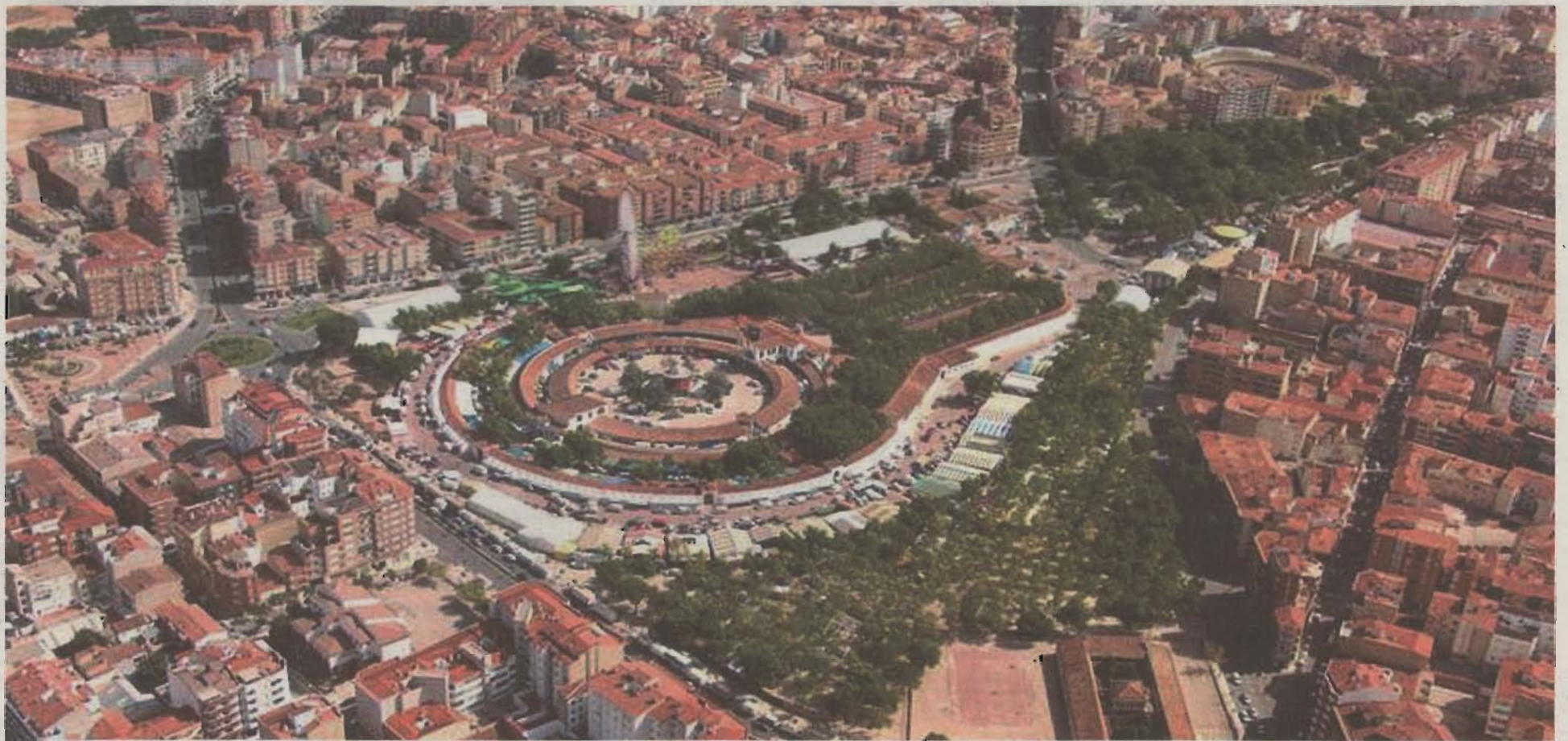
Vista aérea del Recinto Ferial de Albacete.

Montar los 500 puestos de Los Invasores dentro del edificio y organizar ferias comerciales son dos de las sugerencias de los arquitectos para dar contenido a la construcción más singular de la ciudad