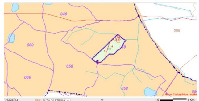
Localización Polígono 49 Parcela 54 CL DISEMINADOS CASA DEL TOCON. EL BONILLO (ALBACETE) Superficie gráfica 477.471 m 2