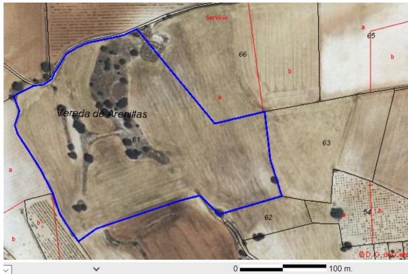
Polígono 12 Parcela 61 Superficie 43.740 m 2