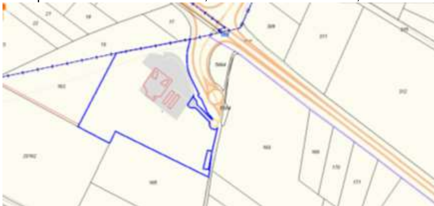
Anexo: Relación de bienes y derechos afectados por las obras del proyecto clave 39-AB-4610 TÉRMINO MUNICIPAL DE LA GINETA. PROVINCIA DE ALBACETE:

Anuncio de información pública sobre aprobación provisional del proyecto de trazado del aparcamiento de emergencia de vehículos pesados en vialidad invernal, A-31 autovía de Alicante, enlace Montalvos Pág. 3